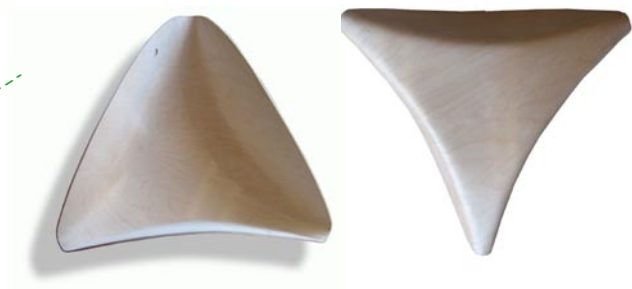
Fig. 3, 4: Modulos triangulares de laterales concavos